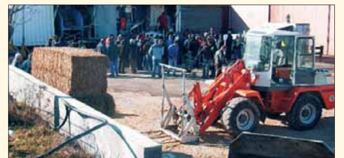
Energie vom Acker: Vorgeführt wird eine mobile Maschine, mit der aus nachwachsenden Rohstoffen wie Stroh Brennstoff für die Pelletsheizung hergestellt werden kann.

Thomas Haag wirkt bei der Studie „Blumenwiese Alb“ mit. Anhand der Pilotregion Schwäbische Alb wird untersucht, wie Ökologie und Ökonomie in einem wirtschaftlichen Konzept zum Einklang gebracht werden können. Für Landwirte ergibt sich dadurch eine weitere Möglichkeit außer Biogasanlagen, in die Energieerzeugung einzusteigen. Der Bauernverband Reutlingen zum Beispiel unterstützt das Ansinnen, auf diese Weise für Landwirte eine weitere Wertschöpf-