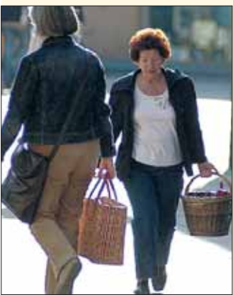
Vom Energietag in und bei der Stadthalle sind es nur wenige hundert Meter in die Innenstadt.

Info Bezahlen können die Besucher auf dem Energietag und in vielen Geschäften der Stadt mit Donau-Taler (siehe Kasten).