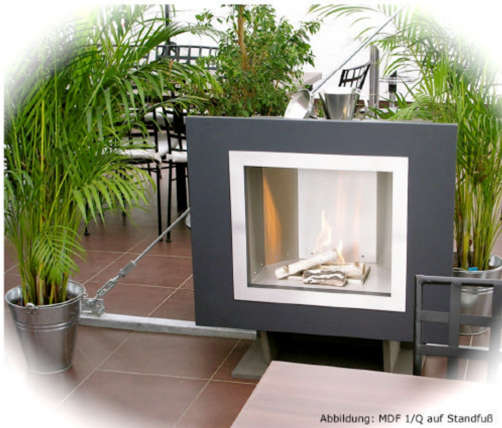
Abbildung: MDF 1/Q auf Standfuß